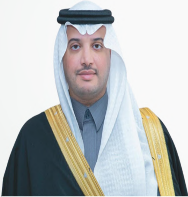
صاحب السمو الملكي الأمير سعود بن طلال بن عبدالعزيز آل سعود