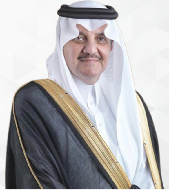
صاحب السمو الملكي الأمير سعود بن نايف بن عبدالعزيز آل سعود