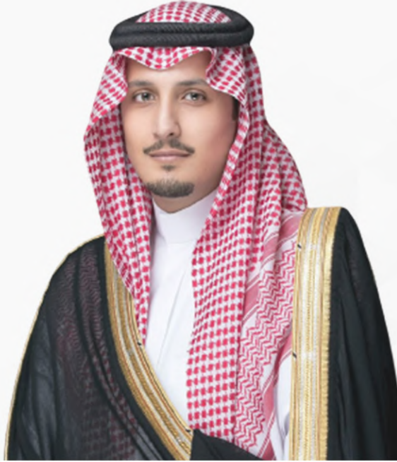
صاحب السمو الملكي الأمير أحمد بن فهد بن سلمان بن عبدالعزيز آل سعود